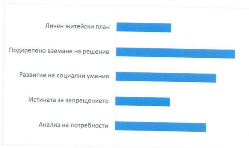
Графика 1 Интерес към темите на уебинарите за родители

През отчетния период беше планиран и реализиран процес на идентифициране на потребности, планиране и реализиране на обучения за професионалисти. Идеята беше да се постигне по-високо ниво на съответствие с потребностите на екипите, предоставящи социални услуги за лица с интелектуални затруднения. Беше изпратена покана до всички членове на БАЛИЗ в страната и получени заявки от 5 екипа. С тези екипи бяха проведени първоначални срещи за проучване на ситуацията в услугите, основните проблеми и предизвикателства в работата във връзка с развитието на самостоятелност и превенция на поставянето под запрещение. Бяха осъществени 5 обучения по договорени теми с общо 51 участника. Анализът на участието показва най-голям интерес към темите Застъпничество и посредничество и комуникация с лица с интелектуални затруднения.